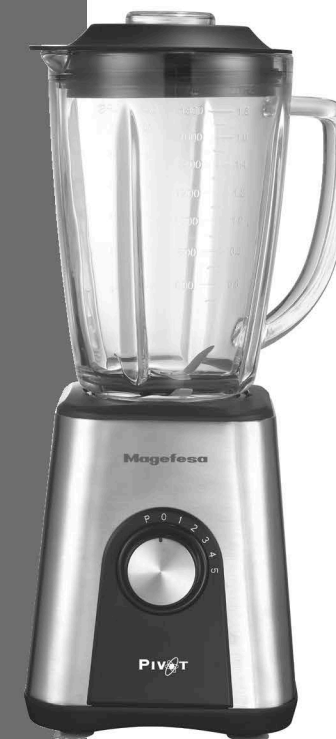
Batidora de vaso